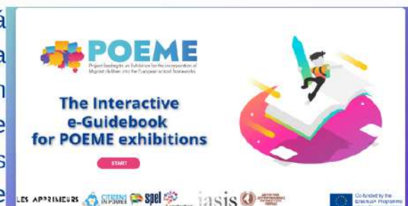
Guia Eletrónico Interativo POEME

Permitem aos alunos experimentar a abordagem tradicional e prática das exposições presenciais, ao mesmo tempo que incorporam elementos interativos e multimédia das exposições online. Este Guia Eletrónico será um recurso significativo para os educadores que procuram criar exposições híbridas interessantes com os seus alunos.